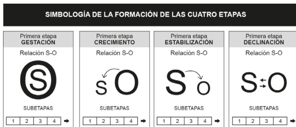
Figura 1. Simbología de la formación de las cuatro etapas y subetapas de la evolución de la conciencia.

Una vez comprendidos los elementos del esquema, se puede advertir que existen Objetos Mayores y Menores, el acceso a los primeros se da a través de la relación con objetos menores, asibles para el sujeto e inteligibles para la mente humana. Conforme se avanza en el proceso de conciencia se puede establecer relaciones con objetos cada vez más grandes. Asimismo, el proceso del desarrollo de la conciencia se sigue tanto a nivel individual como colectivo. En ambos niveles sólo a través de la conformación de Masa Crítica son posibles los cambios de época (primitiva, agrícola, industrial, sociedad consciente); en otras palabras, la evolución de la conciencia como relación Sujeto – Objeto, es un proceso histórico.